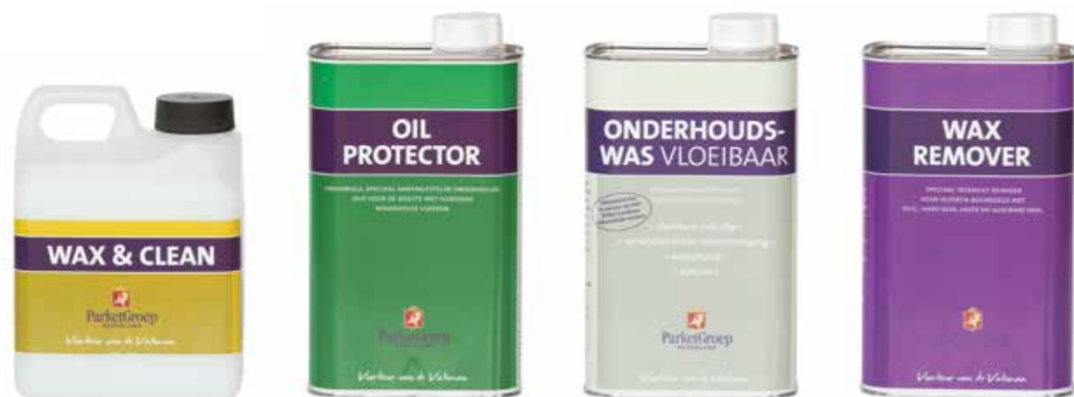
HOUTEN VLOEREN MET HARDWAX (OLIE) BEHANDELD