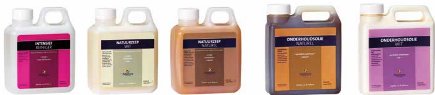
HOUTEN VLOEREN MET OLIE BEHANDELD