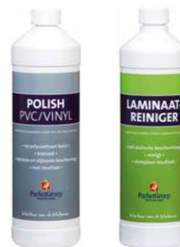
VLOEREN MET KUNSTSTOF OPPERVLAKTE

→ Te bestellen via onze webshop! www.parketgroep.nl